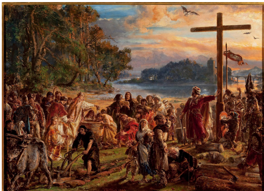
Jan Matejko Zaprowadzenie chrześcijaństwa R.P. 965 , z cyklu „Dzieje Cywilizacji w Polsce”, (1889 rok), olej/deska dębowa; 79 x 120 cm, wł. Muzeum Narodowe w Warszawie, na ekspozycji Zamek Królewski w Warszawie.

Polska weszła na trwałe do rodziny państw europejskich tworzących Christianitas, wspólnotę opartą na humanizmie zrodzonym z kontemplacji Boga. Bezpośrednim motywem do przyjęcia chrztu przez ówczesnego władcę, było jego małżeństwo z czeską księżniczką Dobrawą, niezwykłą niewiastę, która całą resztę swego życia poświęciła ewangelizacji swych poddanych. Pomagał jej w tym przybyły z Pragi