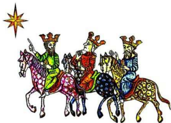
ORSZAK TRZECH KRÓLI

6 stycznia 2013 roku po raz piąty ruszy Orszak Trzech Króli z Placu Zamkowego spod Kolumny Zygmunta. Orszak przejdzie w ponad 70 polskich miejscowościach. Po raz pierwszy Orszak odbędzie się również poza granicami kraju – w Kamieńcu Podolskim, Chmielnickim i Winnicy na Ukrainie, w hiszpańskiej miejscowości Badajoz, a nawet na innym kontynencie – w egzotycznej Republice Środkowoafrykańskiej. Dokładne informacje podane są na stronie orszak.org. Orszak pod hasłem: „Kolędy – lepiej śpiewać niż słuchać”.