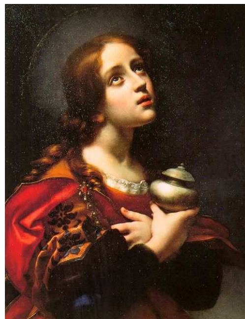
Święta Maria Magdalena.

J ezus natomiast udał się na Górę Oliwną, ale o brzasku zjawił się znów w świątyni. Cały lud schodził się do Niego, a On usiadłszy nauczał ich. Wówczas uczeni w Piśmie i faryzeusze przyprowadzili do Niego kobietę którą pochwycono na cudzołóstwie, a postawiwszy ją pośrodku, powiedzieli do Niego: «Nauczycielu, tę kobietę dopiero pochwycono na cudzołóstwie. W Prawie Mojżesz nakazał nam takie kamienować. A Ty co mówisz?» Mówili to wystawiając Go na próbę, aby mieli o co Go oskarżyć. Lecz Jezus nachyliwszy się pisał palcem po ziemi. A kiedy w dalszym ciągu Go pytali, podniósł się i rzekł do nich: «Kto z was jest bez grzechu, niech pierwszy rzuci na nią kamień». I powtórnie nachyliwszy się pisał na ziemi. Kiedy to usłyszeli, wszyscy jeden po drugim zaczęli odchodzić, poczynając od starszych, aż do ostatnich. Pozostał tylko Jezus i kobieta, stojąca na środku. Wówczas Jezus podniósłszy się rzekł do niej: «Kobieto, gdzież oni są? Nikt cię nie potępił?» A ona odrzekła: «Nikt, Panie!» Rzekł do niej Jezus: «I Ja ciebie nie potępiam. - Idź, a od tej chwili już nie grzesz!».