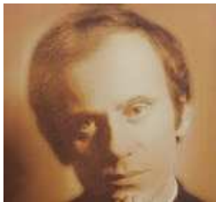
znajomość ks. Popieluszki.

– te słowa św. Pawła głoszone przez ks. Jerzego Popieluszkę widnieją na stronie poświęconej naszemu błogosławionemu. Znajdziemy na niej bogaty materiał składający się z artykułów, wspomnień, wywiadów z ks. Jerzym oraz ... jego zapisków i kazań z lat 1982-1984. Są modlitwy, litanie, nowenny do bł. ks. Jerzego, a także poświęcone mu filmy. Warto zajrzeć na tę stronę, aby pogłębić swoją