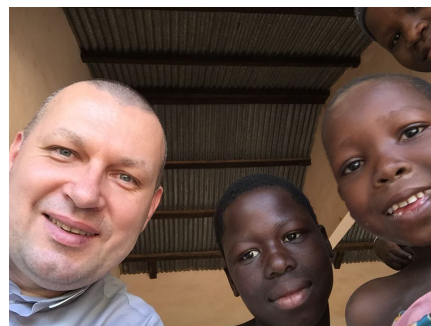
Centrum Misji Afrykańskich w Borzęcinie zaprasza grupy parafialne na konferencje, warsztaty, duchową formację i... świeżo paloną afrykańską kawę! Zwyczajni wierni też mogą tu codziennie przyjść na adorację w Kaplicy i mszę świętą.