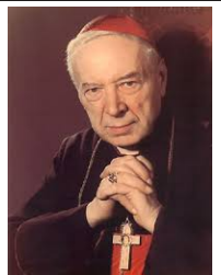
Kardynał Stefan Wyszyński

Duch ciemności jest duchem niepokoju. On nie zawsze dąży do tego, aby nas doprowadzić wprost do grzechu. Często wie, że mu się to nie uda, bo łaska Boża jest w nas wystarczająco silna. Wtedy przynajmniej zasiewa niepokój, stwarzając sto trudności i wątpliwości, które mają charakter niesłuchanie podniosły, a tematykę niemal świętą i religijną. Wynika ona nawet często z troski o Kościół Chrystusowy i Królestwo Boże, o to niemal, aby samemu Bogu starczyło sił do uratowania się i utrzymania na świecie. Wtedy boimy się o wszystkich i o wszystko.