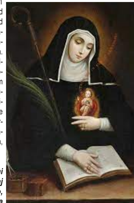
Św. Gertruda Wielka z Helfty

Ojcie Przedwieczny, ofiaruję Ci, Najdroższą Krew Boskiego Syna Twego, Pana naszego, Jezusa Chrystusa w połączeniu ze wszystkimi Mszami świętymi dzisiaj na całym świecie odprawianymi, za dusze w Czyśćcu cierpiące, za umierających, za grzeszników na świecie, za grzeszników w Kościele powszechnym, za grzeszników w mojej rodzinie, a także w moim domu. Amen.