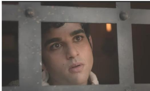
Powołanie Mateusza, kadr z serialu „The Chosen”

NUMER 515 • Dziesiąta Niedziela Zwykła • 10 czerwca 2023 roku