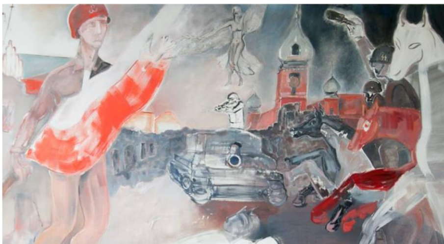
Larysa Jaromska, wierni-prawom-ojczystym