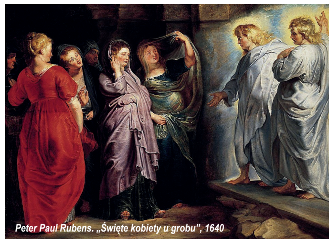
Peter Paul Rubens. „Święte kobiety u grobu”, 1640